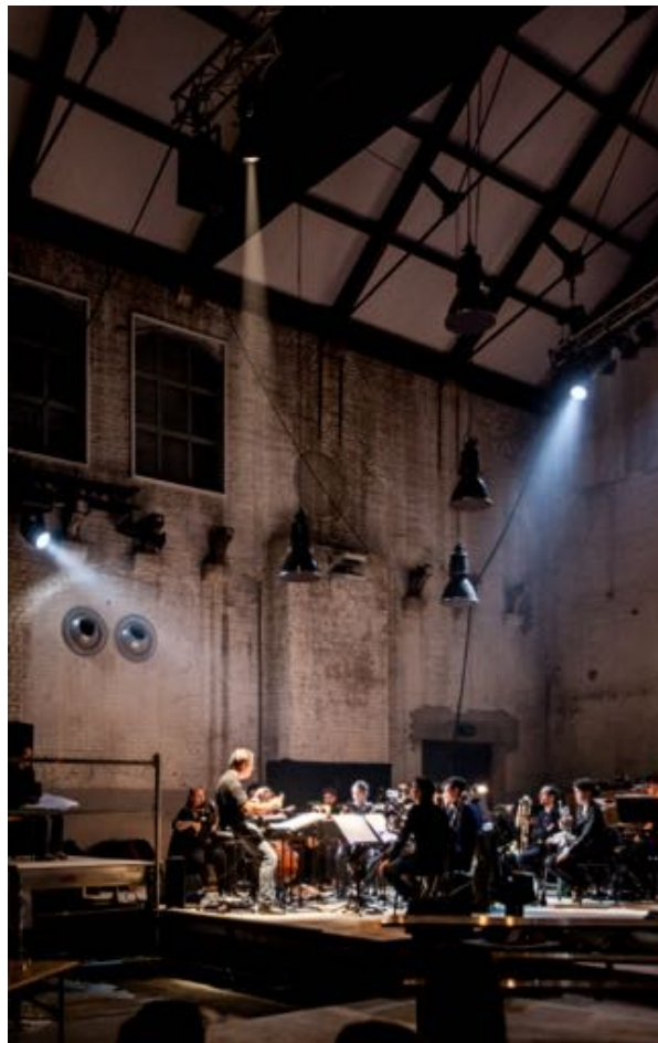
Het ensemble tijdens een repetitie van Traviata Remixed in de Zuiveringshal.

Nieuw Nederlands Operafront is ervan overtuigd dat opera een belangrijke rol kan spelen in onze post- postmoderne samenleving, waarin mensen weer verlangen naar de grote, allesomvattende verhalen en gedeelde ervaringen. In een seculiere maatschappij zou kunst die functie kunnen vervullen die in andere systemen vervuld wordt door religie en ritueel: het centraal stellen van de grote levensvragen, het levendig houden van het debat over gewetenskwesaties, het plaatsen van individuele gevoelens in een groter geheel, het overschrijden van grenzen die in de samenleving heersen om die grenzen daarna opnieuw te kunnen definiëren vanuit een relevanter perspectief. Na een periode waarin het extreme individualisme de boventoon voerde in het postmodernisme, waarin nooit een waarheid werd beschreven maar iedereen zijn eigen verhaal mocht destilleren, lijkt er nu maatschappelijk enorm veel behoefte te ontstaan aan één extreme waarheid. Om te zorgen dat deze behoefte niet slechts vervuld wordt door populistische vertellers, of aangewend voor commerciële doeleinden, zou juist de kunst, met haar genuanceerde inzichten en vanuit haar verschillende perspectieven, deze taak op zich moeten nemen. Opera is daar het perfecte genre voor.